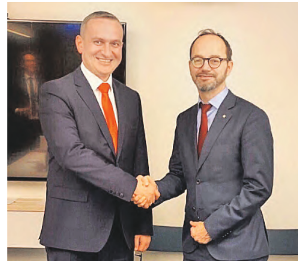
Министр транспорта и коммуникаций Республики Беларусь Алексей АВРАМЕНКО и министр инфраструктуры Швеции Томас ЭНЕРОТ говорили о сотрудничестве в области автомобильного транспорта.

Белорусская делегация выступила с инициативой провести трехстороннюю встречу с латвийским коллегой и обсудить возможные механизмы взаимовыгод-