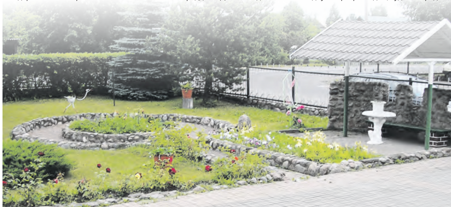
Этот прелестный зеленый уголок – вход в ДРСУ-107.

...Причина массового привлечения к добровольному благоустройству населения региона проста: бюджетные средства ограничены, службе ЖКХ сложно охватить весь райцентр в одиночку. Как выход – закрепление за предприятиями, организациями, учреждениями территорий, на которых они расположены. Правда, круг их деятельности со временем значительно расширился. Нынче в горпоселке стало