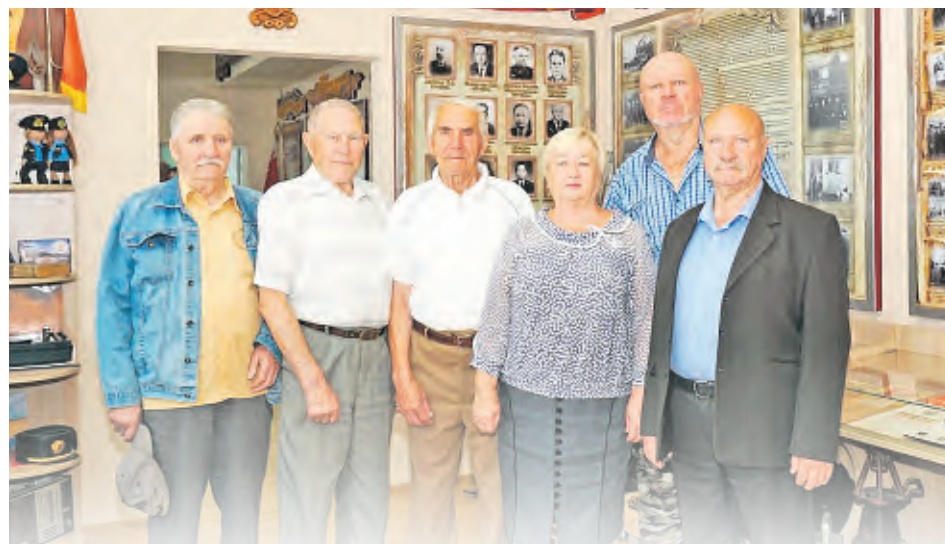
В локомотивном депо Могилев бережно хранят память о прошлом. И открытие обновленной комнаты истории, которое состоялось нынешней осенью, ярчайшее тому подтверждение.

в экспозиции комнаты истории. С ней железнодорожники ходили еще до революции: там и запас продуктов хранился, ведь поездка могла длиться несколько дней, и все необходимые инструменты. Но такой аксессуар мог себе позволить заказать у жестянщика работник стальной магистрали, лишь дослужившись до помощника машиниста, а для этого нужно было поработать слесарем и кочегаром.