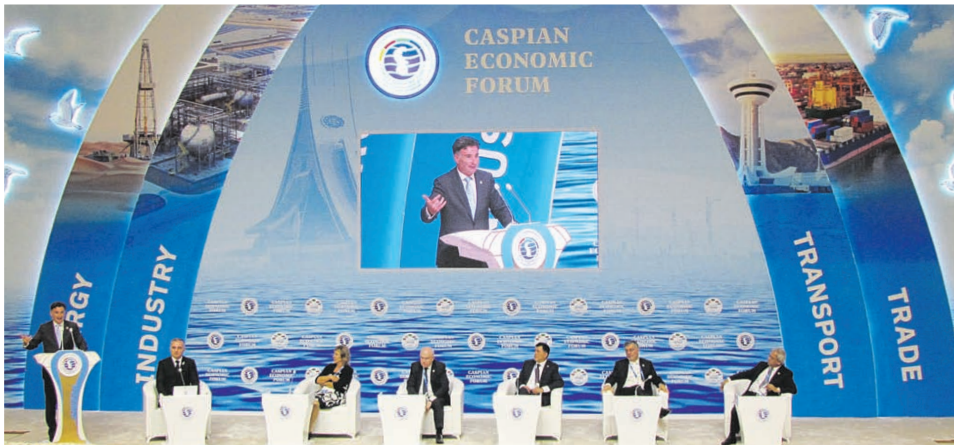
Пленарное заседание первого Каспийского экономического форума (12 августа, г. Туркменбаши). Выступление генерального секретаря Международного союза автомобильного транспорта Умберто де Претто.

Туркменистана посетили Беларусь с целью обучения, туризма, лечения, оздоровления. В этом плане прошлый год был рекордным. Сейчас тоже идем с плюсом. Достаточно назвать только одну цифру: в нашей стране получают образование около 10 тысяч туркменских студентов.