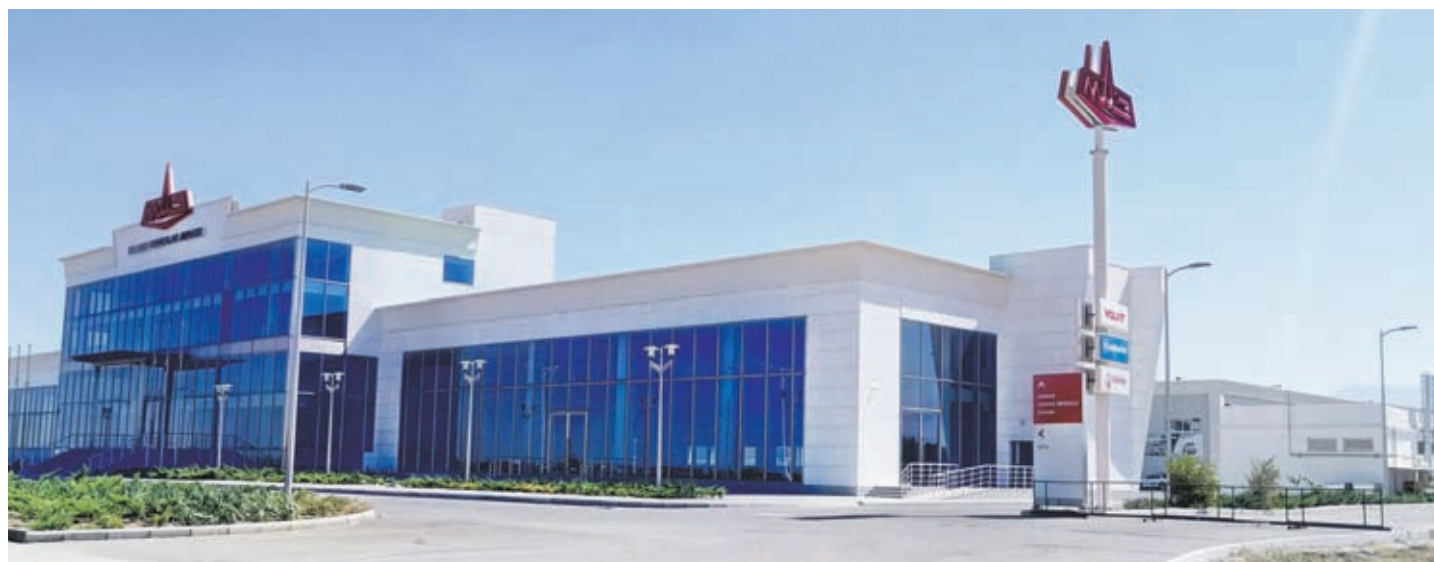
Сервисный центр белорусской техники в Ашхабаде. Здесь будут организованы продажа и сервисное обслуживание продукции белорусского машиностроения, а также реализация запасных частей к ней.

Думаю, форум каспийских государств станет импульсом к активизации нашей совместной работы. О его результатах говорить еще рано, но уверен, что они будут. Вы посмотрите, какой уровень: пять премьеров – России, Болгарии, Узбекистана, Казахстана, Азербайджана, вице-президент Ирана. Они сюда неслучайно приехали, не на экскурсию, а за результатом, так как видят огромный потенциал. Мы тоже должны многое почерпнуть для себя из этого форума.