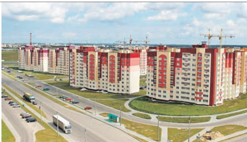
Микрорайон Ольшанка с другими районами города свяжет экологически чистый транспорт.

К 75-летию Гродненщины активно готовятся и транспортники. В областном центре планируется открытие двух новых маршрутов, по которым будут перевозить пассажиров троллейбусы с автономным ходом.