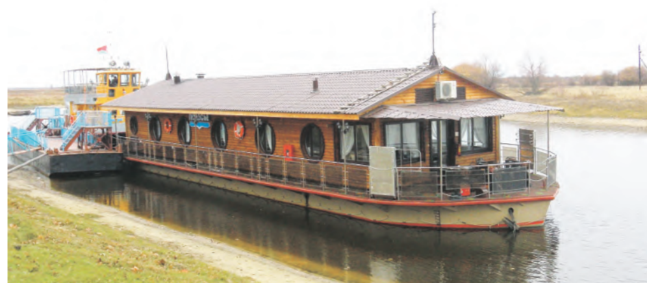
Эта плавучая гостиница – разработка ОАО «Белсудопроект».