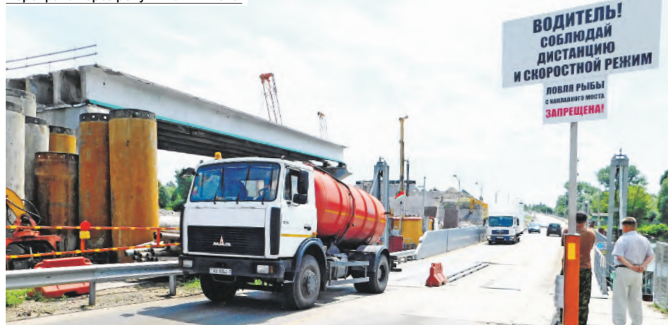
Переправа через реку Пина в Пинске.