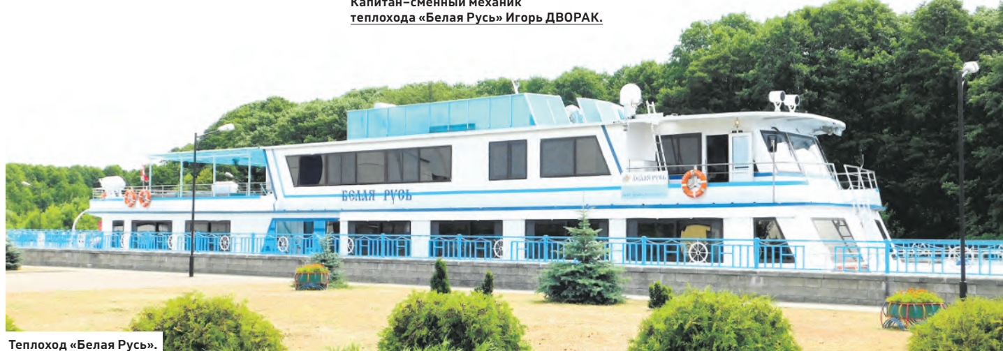
Теплоход «Белая Русь».