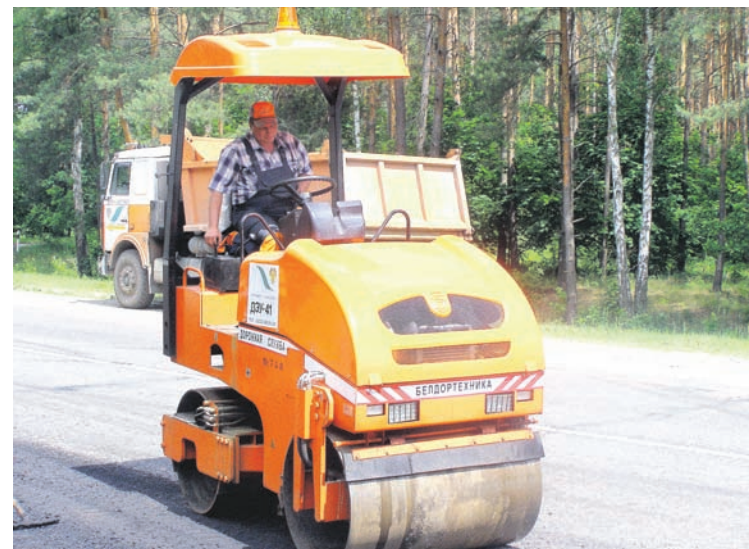
Валентина ШИНКЕВИЧ, «ДБ»

зация труда, внедрение передовых технологий, рациональное использование имеющихся ресурсов позволяют коллективу успешно справляться с поставленными задачами. В 2018 году, например, филиал выполнил все запланированные показатели прогноза социально-экономического развития. Общая выручка составила 5369 тысяч рублей. Из них на содержании автодорог освоено 3307 тысяч, текущем ремонте – 1622 тысячи, по прочему подряду – 280 тысяч рублей. Оказано автоуслуг на сумму 160 тыс. рублей.