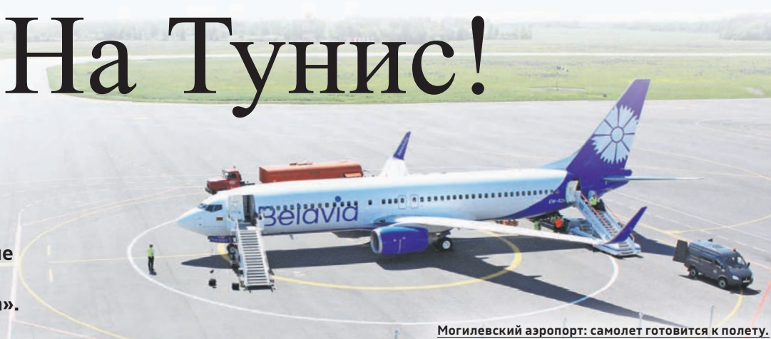
Могилевский аэропорт: самолет готовится к полету.

Сегодня аэропорт Могилев – это воздушная гавань, соответствующая европейскому