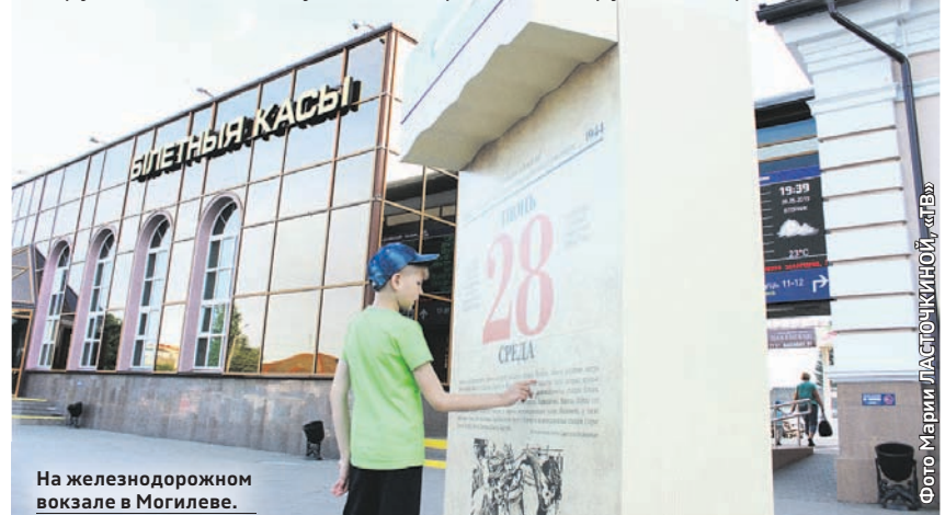
На железнодорожном вокзале в Могилеве.