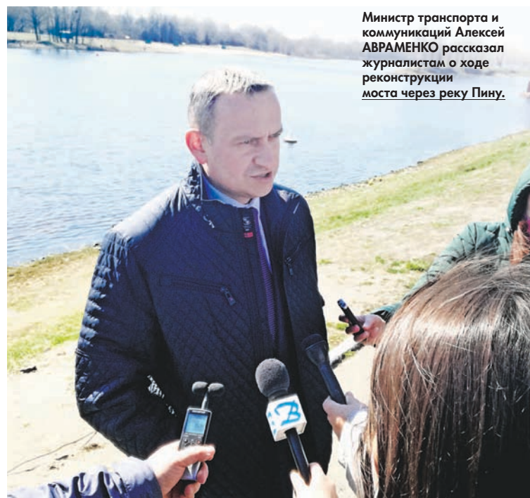
Министр транспорта и коммуникаций Алексей АВРАМЕНКО рассказал журналистам о ходе реконструкции моста через реку Пину.

интенсивность движения. На данный момент наиболее актуальна тема выполнения работ на участке дороги М10 Гомель – Калинковичи протяженностью почти 100 км. Планирование реконструкции участков в Брестской области – в перспективе, – проинформировал Алексей Авраменко.