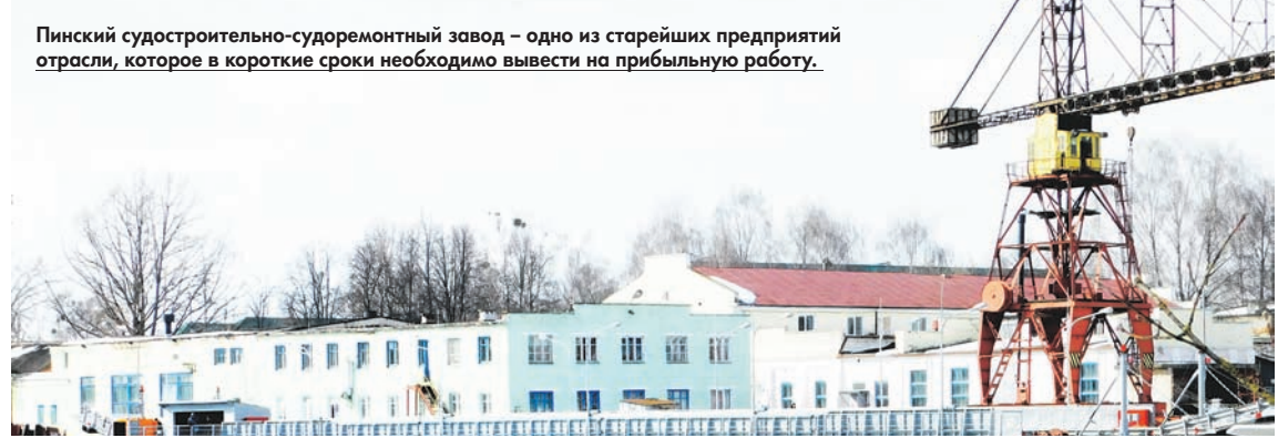
Пинский судостроительно-судоремонтный завод – одно из старейших предприятий отрасли, которое в короткие сроки необходимо вывести на прибыльную работу.

Встреча с коллективом РУЭСР «Днепробугводпуть» завершилась торжественной церемонией. В прошлом году предприятие приняло непосредственное участие в реконструкции моста через реку Припять в Житковичском районе. По итогам работы ряд его сотрудников указом главы государства были удостоены государственных наград, другие – почетных грамот Минтранса и Сове-