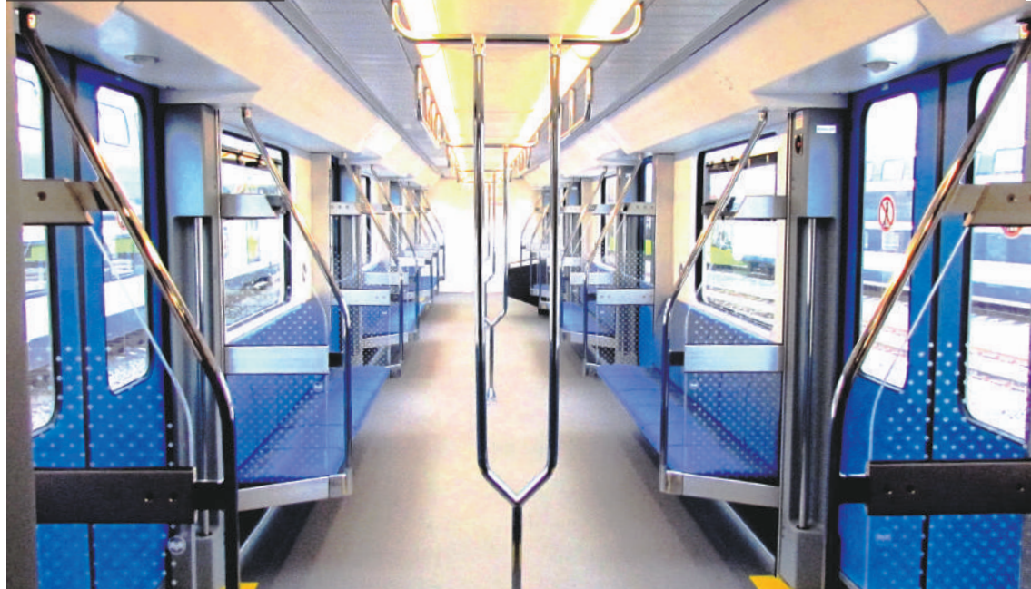
Так выглядит салон нового поезда.

Очень важной технической характеристикой нового электропоезда является экономичный удельный расход электро-