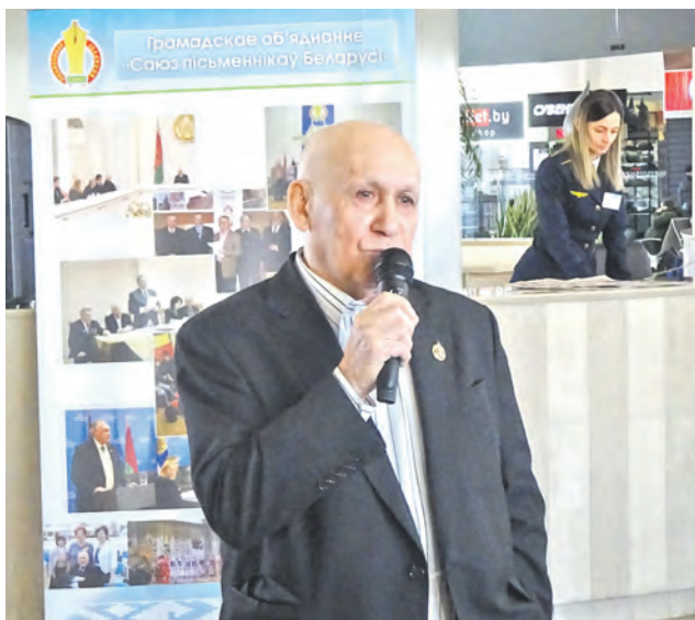
Народны артыст Беларусі кампазітар Эдуард ХАНОК.