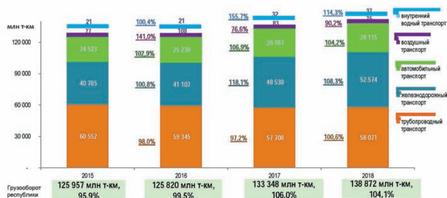
ГРУЗОБОРОТ ТРАНСПОРТА РЕСПУБЛИКИ БЕЛАРУСЬ