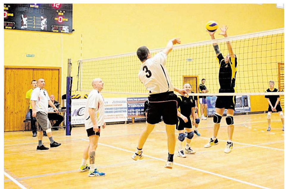
Мастерство и спортивный азарт царили на игровой площадке.