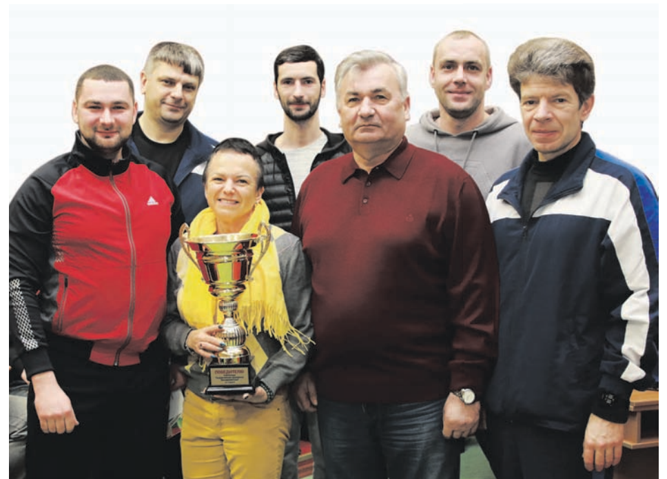
Кубок – победителям.

Чтобы разнообразить традиционную программу соревнований, в качестве эксперимента командам была предложена новая интеллектуально-развлекательная игра «Воздушный бой». Ее ор-