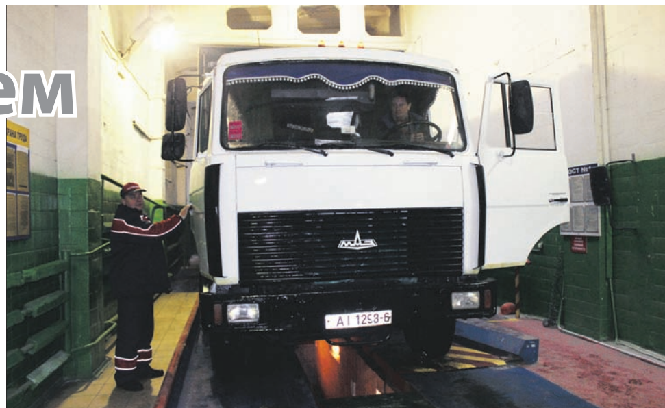
Более 500 машин в месяц проходят гостехосмотр на диагностической станции № 195 Климовичского филиала Автопарк № 9.

В настоящее время автопарк обслуживает 10 пригородных маршрутов и четыре городских, а также один междугородный, который связывает районный центр с областным – городом Могилевом. Предприятие выполняет социальные стандарты по транспортному обслуживанию населения более чем на 100%.