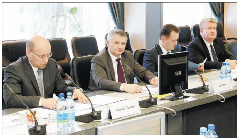
Во время переговоров Белорусской железной дороги и ведущей логистической компании Китая об организации перевозок грузов контейнерными поездами, 9 апреля 2018 года.

Подготовил Игорь ПЕТРОВСКИЙ