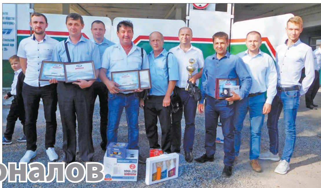
Первое место – у команды гомельского филиала «Автобусный парк № 6».