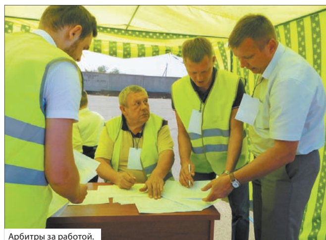
Арбитры за работой.