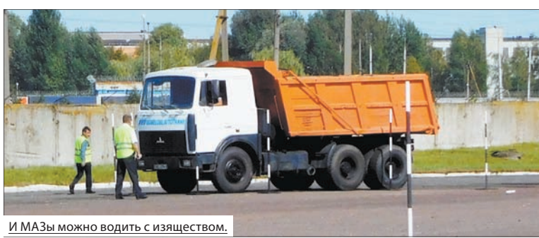
И МАЗы можно водить с изяществом.