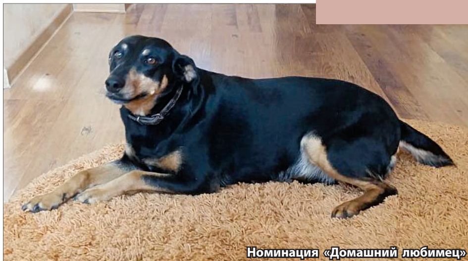
Номинация «Домашний любимец»