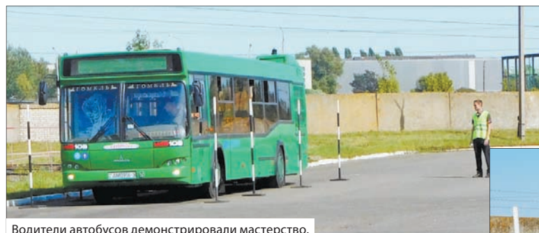
Водители автобусов демонстрировали мастерство.