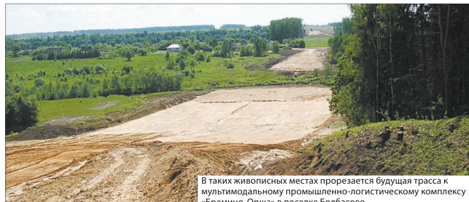
В таких живописных местах прорезается будущая трасса к мультимодальному промышленно-логистическому комплексу «Бремино-Орша» в поселке Болбасово.

Выпало труженикам треста в первом полугодии трудиться и в России, на строительстве автомагистрали М-11 Москва – Санкт-Петербург. Надеются поработать в Пскове. Впрочем, об этом говорить еще рано – масштабная деятельность не развернулась. За любой выгодный заказ берутся дорожные строители из Витебска, будучи в постоянном поиске надежных партнеров. Свою лепту они внесли в июле в благоустройство областного центра, положив новое асфальтобетонное покрытие на проспекте Строителей. Жаль, нуждающаяся в услугах дорожников коммунальная служба не может себе позволить замахнуться на большее. Все упирается в средства.