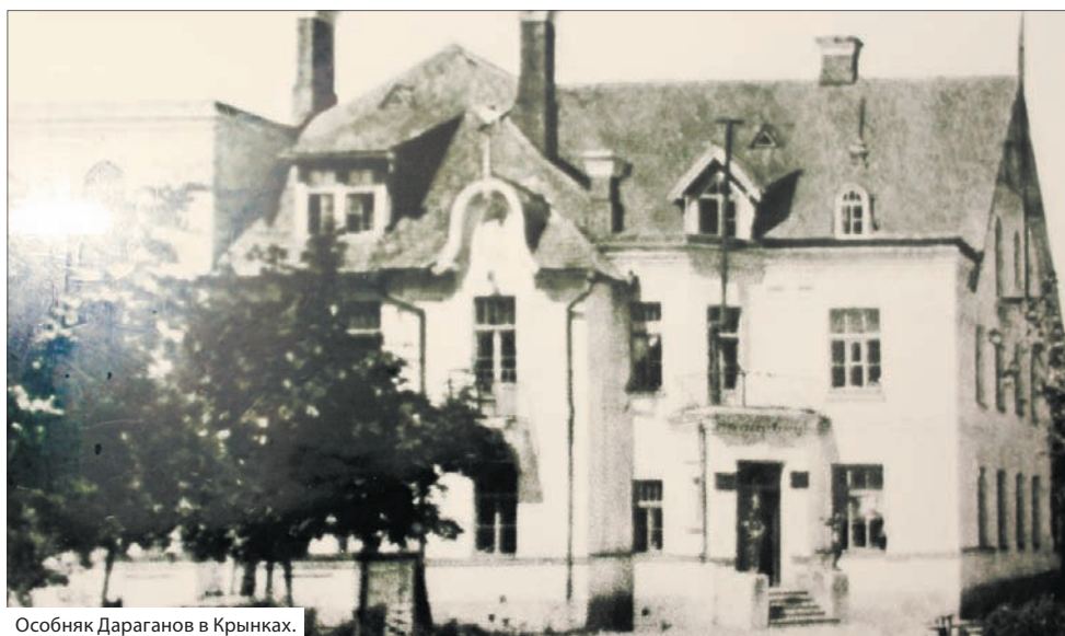
Особняк Дараганов в Крынках.