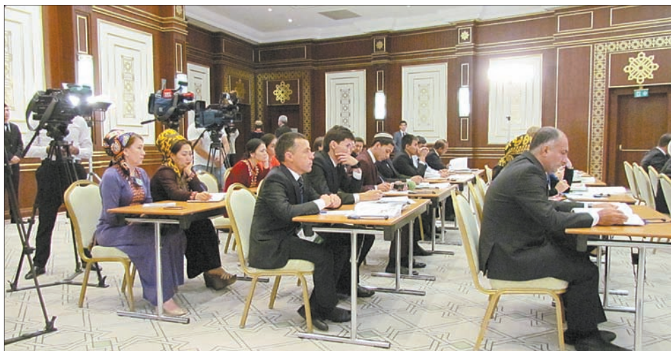
Медиафорум собрал представителей СМИ из 16 стран.

озера, уникального рукотворного водоема посреди пустыни. Также в местечке Гызылга участники авторалли смогут увидеть красные пески и скалы.