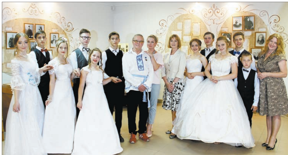
Экспозиция не только живет своей жизнью – здесь проводятся литературные вечера и балы.