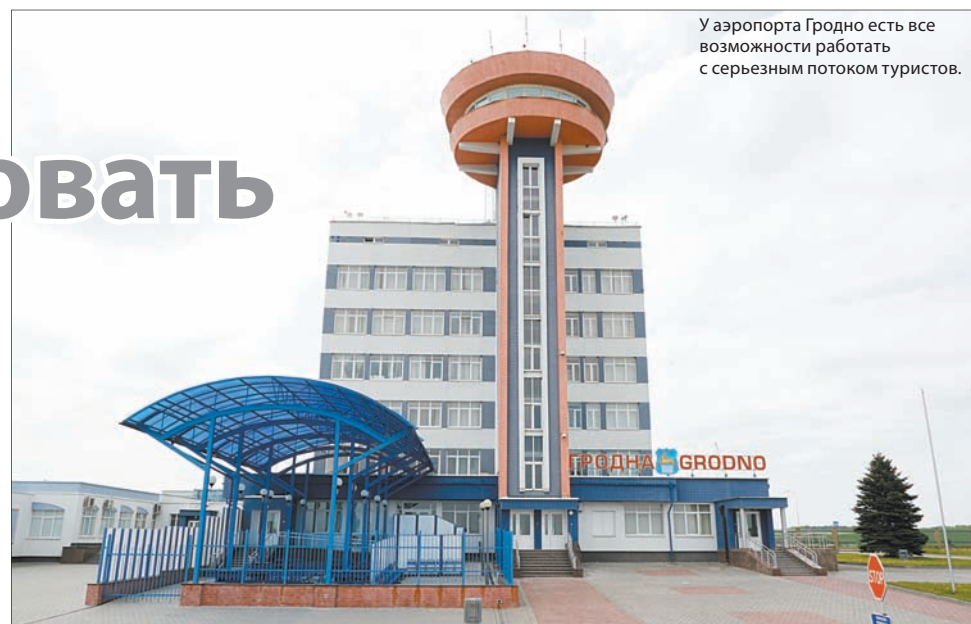
У аэропорта Гродно есть все возможности работать с серьезным потоком туристов.