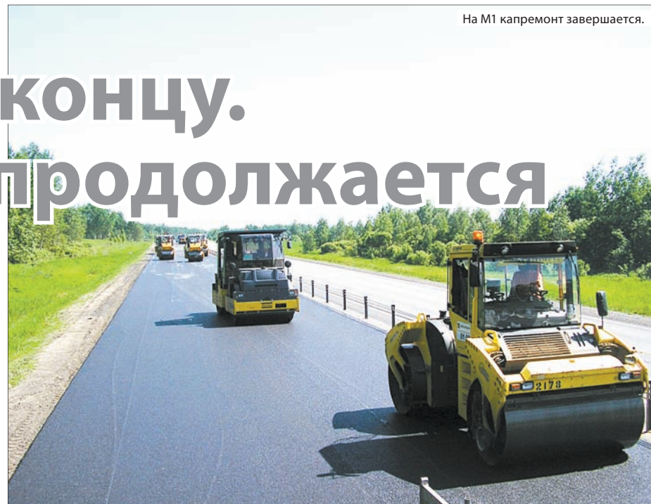
На М1 капремонт завершается.

Новая дорога, на возведение которой пойдет 19 тысяч кубометров тяжелого бетона для устройства дорожного полотна шириной 7 метров, прорежет местный живописный пейзаж мощной бетонной стрелой, окантованной асфальтобетонными укрепленными обочинами по два с половиной метра каждая. Она срежет полукруг, ведущий сегодня в объезд к мультимодальному промышленно-