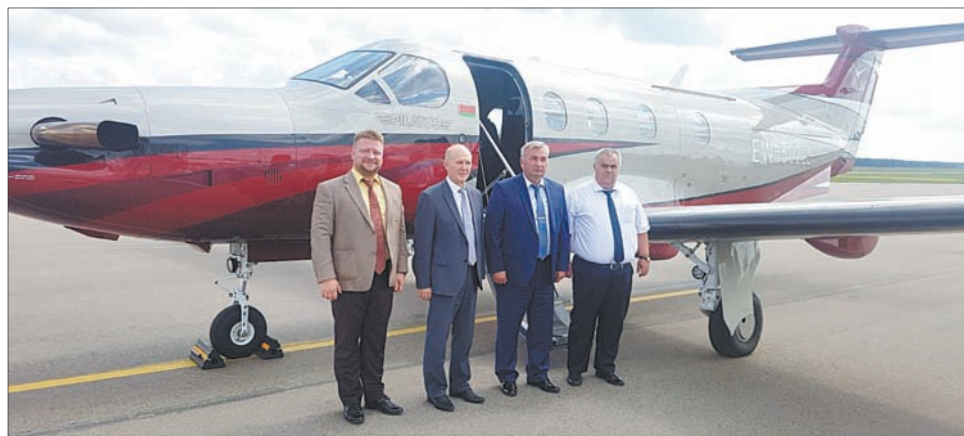
Участники семинара – у самолета ЗАО «Авиакомпания «Байскай».

С 1 июня этого года три раза в неделю регулярные полеты по маршруту Москва (Домодедово) – Гомель – Москва (Домодедово) выполняет российская авиакомпания S7 Airlines. Сейчас ведутся переговоры с руководством польских авиакомпаний LOT и SprintAir по вопросу открытия регулярных и чартерных рейсов через аэропорты Брест и Гродно (по программе безвиза) и в аэропорт Гродно из Израиля.