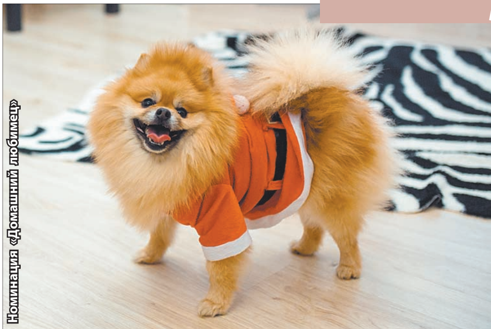
Номинация «Домашний любимец»

Чтобы стать участником номинации «Домашний любимец» или «Служим-дружим», следуйте нескольким несложным правилам: