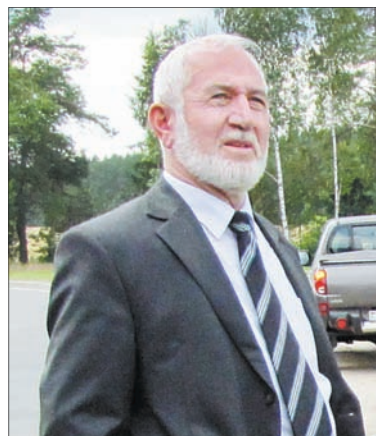
У начальника СУ № 1 ситуация всегда под контролем.

от времени сборных тротуарных блоков, устройство новых монолитных тротуаров, замена перильного ограждения, ремонт опорных конструкций. И все это – на путепроводе длиной 60 метров.