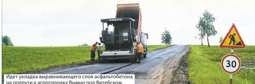
Идет укладка выравнивающего слоя асфальтобетона на полпути к агрогородку Вымно под Витебском.

О качественной местной дорожной сети мечтают все: от пользователей до специалистов, отвечающих за ее состояние. Кажется, лед тронулся: ремонт развернулся во всех регионах.