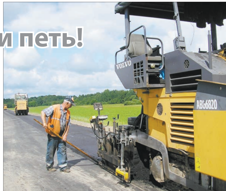
Ведется текущий ремонт подъезда к деревне Фокино через деревни Большухи и Вымно от Р112 Витебск – Сураж – граница Российской Федерации.

Все заинтересованы в выполнении значительных объемов малыми силами, ведь от этого зависит в том числе и уровень заработной платы. Она, между прочим, в целом по ДРСУ выросла на 180 рублей в сравнении со среднемесячной за минувший год. И рост на этом не остановится, судя по увеличению выручки от реализации работ и материалов. По оперативным данным, за полугодие она на 29 процентов превысила показатель за аналогичный период минувшего года и составила 1656 тысяч рублей. При этом кадровый состав, по сути, не изменился, да и техники, в общем-то, не прибавилось.