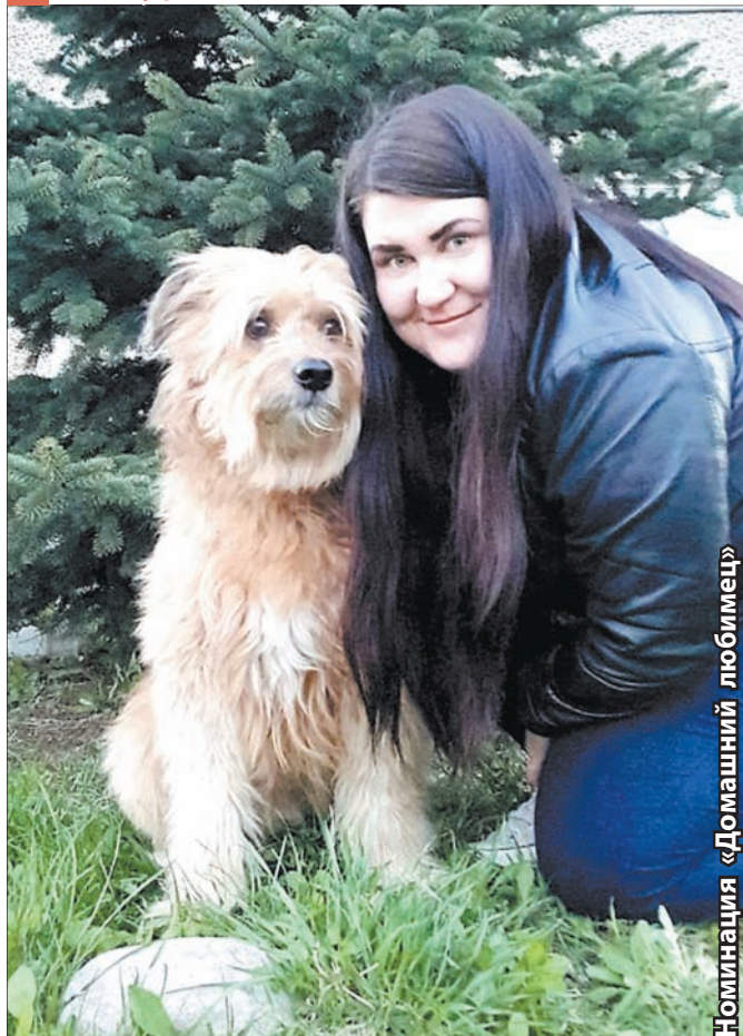
Номинация «Домашний любимец»