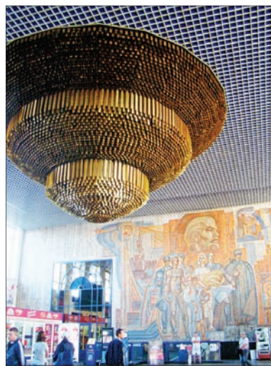
В ходе реконструкции железнодорожный вокзал лишился своего символа последних лет – двухтонной люстры из латуни со стальным каркасом. Она появилась в этом здании после предыдущей реконструкции в 1996 году.

В рамках обеспечения транспортной безопасности количество камер наблюдения увеличено с 64 до 482 – на территории вокзала теперь не осталось «белых пятен».