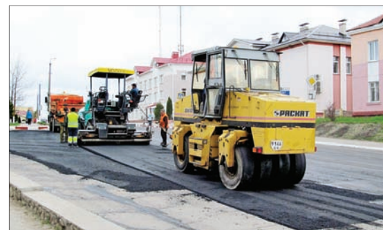
Асфальтирование улиц райцентра ведут местные дорожники.

В активное благоустройство Шарковщины включится и ДСУ № 26 ОАО «ДСТ № 1, г. Витебск». На улице Молодежной, которую его коллектив должен привести в порядок, появятся наконец новые тротуары и бордюры.