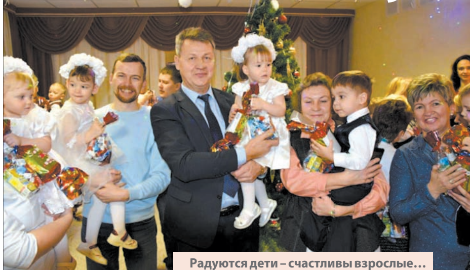
Радуются дети – счастливы взрослые...