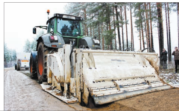
Участникам семинара продемонстрировали современную технику в действии.